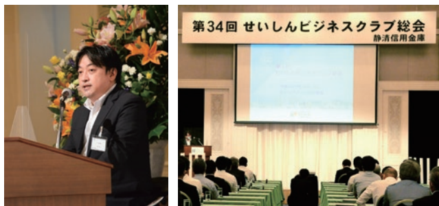
令和4年度 第34回せいしんビジネススクラブ 総会

せいしんビジネススクラブ(SBC)はお取引先企業の若手経営者・後継者の方の育成支援と異業種交流を目的に活動しております。SBCでは、経営研究会、時宜に応じたセミナー、従業員向け研修、国内外の視察研修等を開催しております。