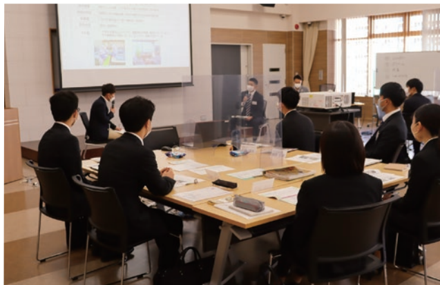
インターンシップの様子

令和4年12月から対面形式でのインターンシップを再開し、多くの学生に信用金庫業務を肌で体験いただきました。