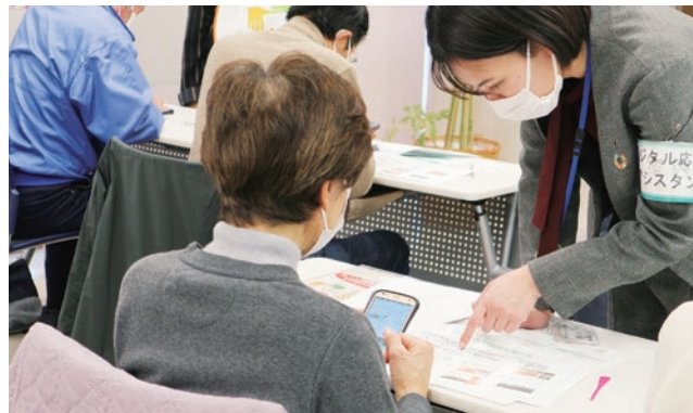
スマホ教室の様子

総務省が管轄する「令和4年度利用者向けデジタル活用支援推進事業」における事業実施団体として、令和4年10月～令和5年2月にかけて、スマホ教室を開催いたしました。