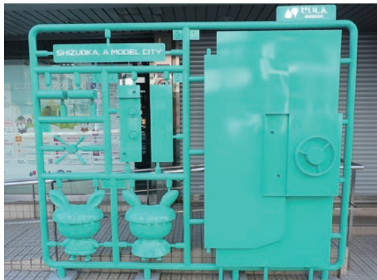
「プラモニュメント」

静岡市が取組む「静岡市プラモデル化計画」の趣旨に賛同し、令和5年2月、当金庫オリジナルの“プラモニュメント”を設置いたしました。