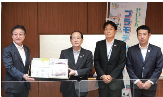
プラモデル贈呈式(静岡市)

多くの子供たちに静岡が世界に誇るプラモデルの楽しさを知っていただくため、静岡市・焼津市・藤枝市を通じてプラモデル計2,000個を寄贈いたしました。