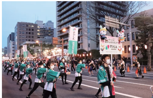
静岡まつり「夜桜乱舞」の様子

地域貢献の一環として、第66回静岡まつり「夜桜乱舞」に参加いたしました。第41回静岡まつり(平成9年)から参加し、今回で24回目の参加となりました。