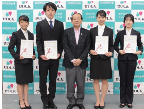
奨学生認定書授与式

令和4年7月、地元大学生4名に奨学金を授与いたしました。地域の未来を支える人材を育成するため、これまで90名の学生に奨学金の授与を行っております。