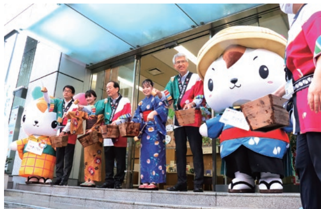
打ち水大作戦 出陣式

地球温暖化防止ならびに熱中症対策を目的として、「打ち水」活動を行いました。今年で16年目を迎える恒例行事です。