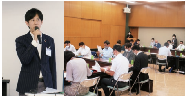
情報交換会の様子

SDGsに取組む事業者60社以上にご参加いただいております。令和4年度は情報交換会を4回開催し、各社の取組み事例紹介やビジネスマッチングなどを行いました。