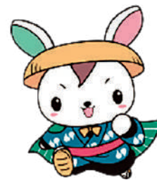
当金庫キャラクター かけるくん