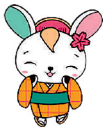
当金庫キャラクター きくのちゃん