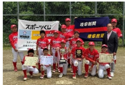
6年生の部優勝「関中央」