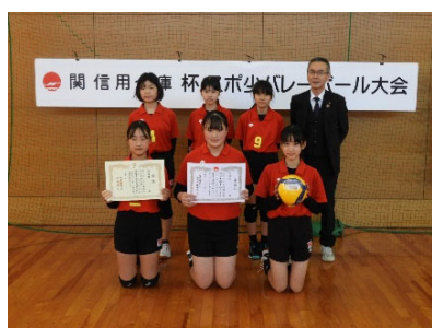
優勝の田原バレー