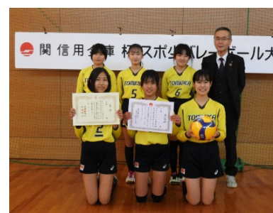
3位の富岡ヴィクトリーズA