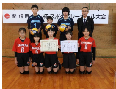
準優勝の関旭ヶ丘ジュニアA