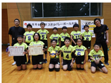
準優勝「洞戸ジュニアバレーA」