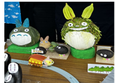
当金庫の東支店が出展した作品が、最優秀賞に選ばれました。