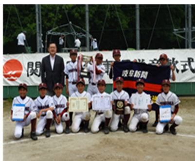
6年生の部「富岡野球」

4月～6月 第14回関信用金庫杯学童軟式野球大会を開催しました。 優勝チームは下記の通りでした。