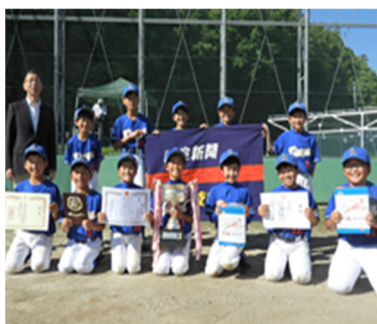
5年生の部「金竜野球」