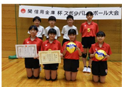
優勝「関旭ヶ丘ジュニアA」