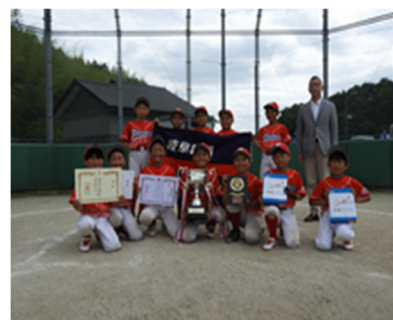
4年生の部「関中央野球」

5月 関市、関商工会議所、当庫の共催で、ビジネスプラス展 in SEKIを開催しました。