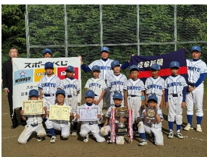
5年生の部優勝「金竜」