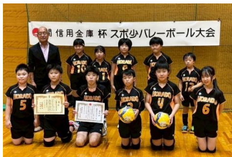
優勝「洞戸ジュニアバレー」

令和7年8月11日(月)にアテナ工業アリーナにて「第8回 関信用金庫杯スポ少バレーボール大会」を開催しました。