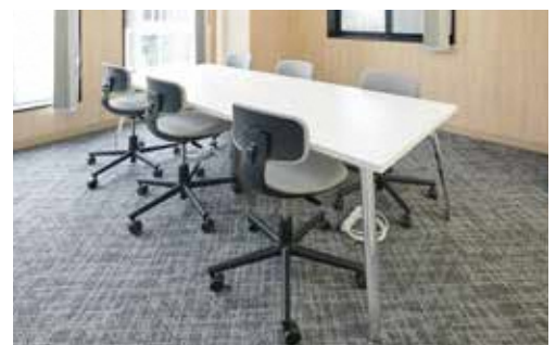
フリーフロア 会議室、フリーデスク、テーブル等を使用できます。 商談・打ち合わせ等でご利用ください。