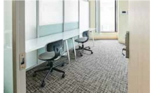
インキュベーションルーム(各6室 / 5.73~11.74m 2 ) 各部屋パーティションで仕切られています。