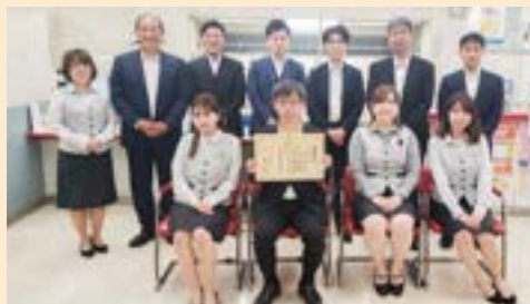
警察署から感謝状を受けた職員

また、警察署との連携を強化し特殊詐欺を防止することを目的に、北沢・世田谷・成城の各警察署と「特殊詐欺に関する覚書」を締結しています。