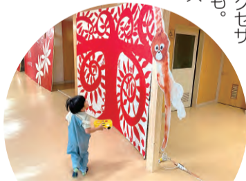
▲廊下にも大きな絵がずらり

岩見沢市の山あいは東部丘陵地域と呼ばれ ています。「東部」を「見る」で「みる・とーぶ」と いう名前が生まれました。旧中学校のたくさ んある教室の扉をひとつずつ開けていくと、さ あ、どんな楽しみが待っているでしょう。アツと 驚く絵や写真に出会うかも知れません。おしゃ れな食器やバッグ、アクセサ リィが待っているかも。 週末には飲食ブース もあり、ライブコン サートが行われる日 も。アートにふれて 心を遊ばせたあと は、近くの温泉でリ ラックスするのも良 いですね。