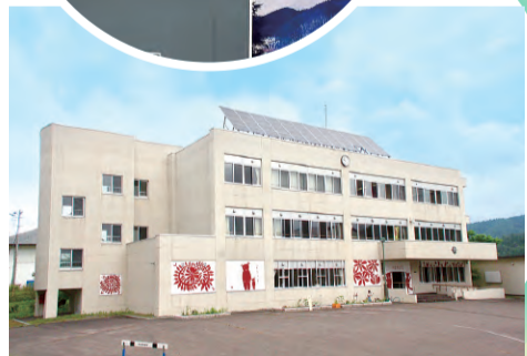
▲会場となる旧美流渡中学校