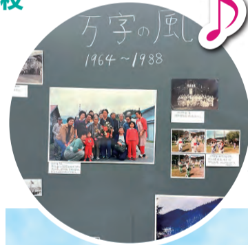
▲万字地区の懐かしい写真