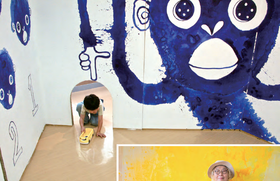
▲子ども大喜びの遊べる展示も♪