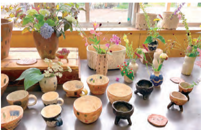
▲展示作品は購入もできる