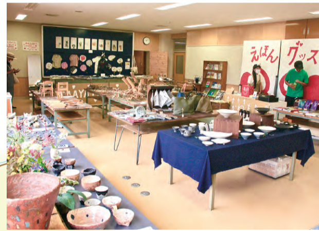
▲地元アーティストの作品がぎっしり