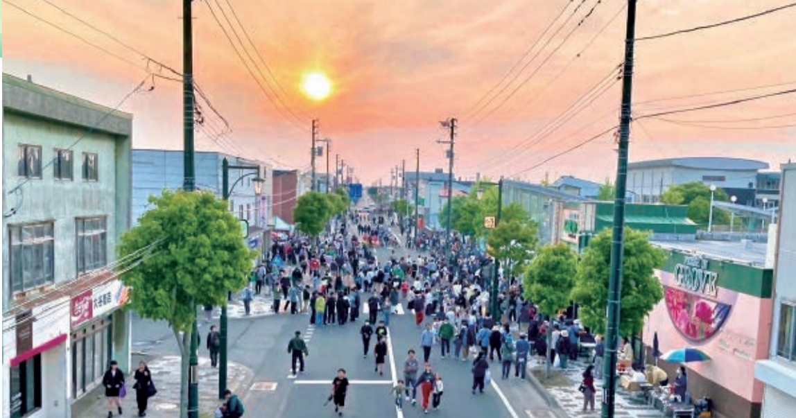
▲夕やけに照らされた会場

毎年5月から9月まで年5回開催される「夕やけ市」は、長沼町のメインストリート「本通商店街」の名物イベントです。4年ぶりの開催となった今シーズンは、秋分の日9月23日(土・祝)が最終日となります！みなさんお誘い合わせの上、お出かけください。