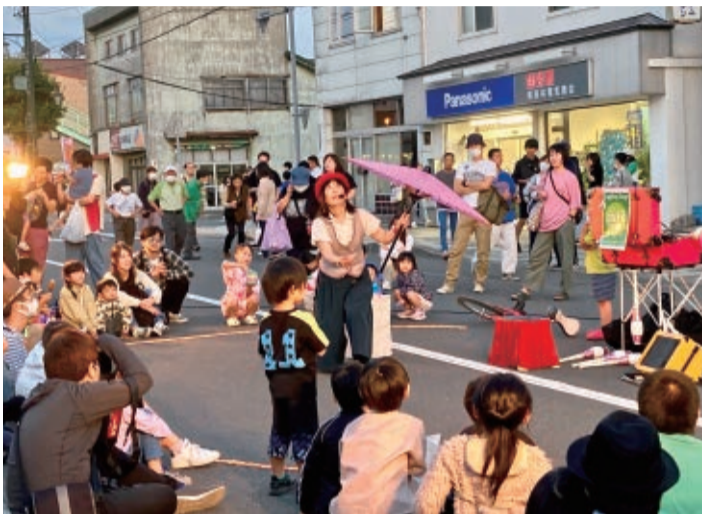
▲大道芸人によるパフォーマンス

商店街500mが歩行者天国に♪ 夕やけの美しいまち長沼町で、平成7年にスタートした「夕やけ市」。子どもからお年寄りまで楽しめるイベントとして、今年で25年目を迎えています。会場となる本通り商店街は歩行者天国となり、露店やゲーム、吹奏楽演奏、大道芸、ストリートダンス、お買い得セール、フリーマーケット、新鮮野菜の販売などが開催されて大賑わい。近郊からもたくさんの方が訪れ、そぞろ歩きを楽しんでいます。