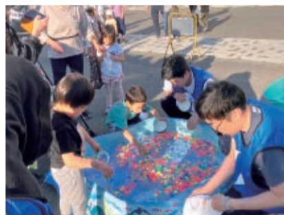
▲子どもが喜ぶ縁日の出し物

商店街のもてなしに心あたたまるひととき 市街地で営業しているたくさんのお店も、この日は屋台として出店します。例えば、電気店がおでん、靴屋さんがクレープ、美容室がそばうどん、家具屋さんがラーメンを提供するなど、各店がいつもと違う商品で接客します。お手頃なグルメを味わいつつ、大道芸やライブ演奏を眺めて、笑顔いっぱい楽しい時間を訪れた人を迎えてくれる、商店街のあたたかなもてなしは、夕やけ市ならではの魅力となっています。