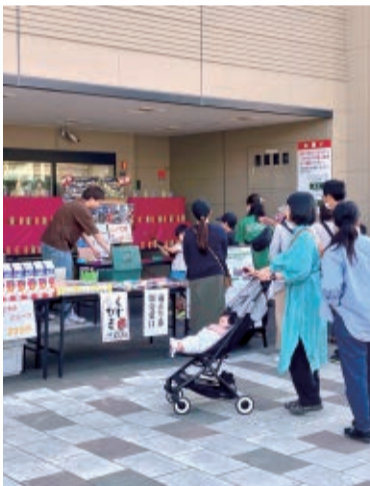
▲グルメとゲームで大人もワクワク

商店街のもてなしに心あたたまるひととき 市街地で営業しているたくさんのお店も、この日は屋台として出店します。例えば、電気店がおでん、靴屋さんがクレープ、美容室がそばうどん、家具屋さんがラーメンを提供するなど、各店がいつもと違う商品で接客します。お手頃なグルメを味わいつつ、大道芸やライブ演奏を眺めて、笑顔いっぱい楽しい時間を訪れた人を迎えてくれる、商店街のあたたかなもてなしは、夕やけ市ならではの魅力となっています。