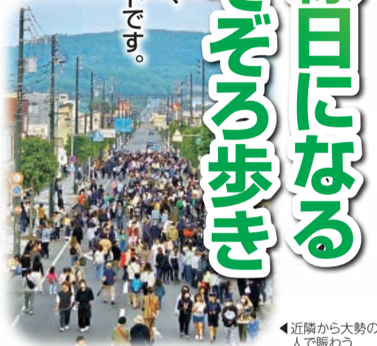
◀近隣から大勢の人で賑わう

商店街500mが歩行者天国に♪ 夕やけの美しいまち長沼町で、平成7年にスタートした「夕やけ市」。子どもからお年寄りまで楽しめるイベントとして、今年で25年目を迎えています。会場となる本通り商店街は歩行者天国となり、露店やゲーム、吹奏楽演奏、大道芸、ストリートダンス、お買い得セール、フリーマーケット、新鮮野菜の販売などが開催されて大賑わい。近郊からもたくさんの方が訪れ、そぞろ歩きを楽しんでいます。