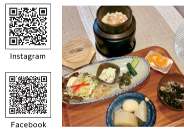
鶏、ホタテのほか仕入れて具材が変わる「釜飯定食」と種類も豊富なシフォンケーキは全20種類