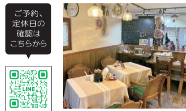
▲オーナーのDIYによるアンティーク調の店内