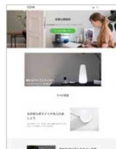
「ONE ITEM LP」 イメージ図