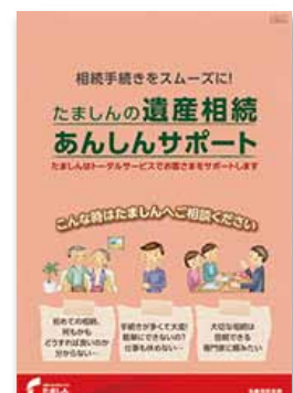
「遺産相続あんしんサポート」パンフレット