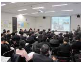
創業支援センターTAMA 連携機関賀詞交歓会

創業支援センターTAMAとは、当金庫が運営する創業支援のプラットフォームのことです。地域の創業支援機関と覚書を結び連携しながら多摩地域で幅広く活動しています。覚書を結んでいるのは平成26年3月末時点で自治体・大学・各支援団体等、全29機関です。今後も連携機関は増える予定です。