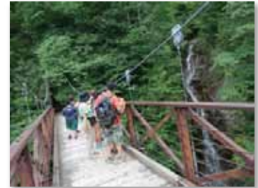
東京都檜原都民の森にて