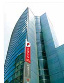
ブルームセンター全景