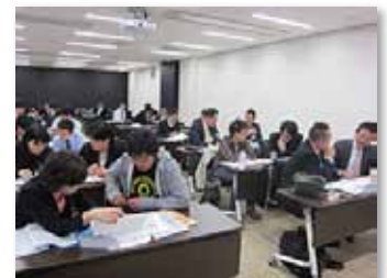
TAMA NEXT リーダープログラム 講義風景