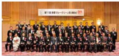
第11回多摩ブルー・グリーン賞 表彰式