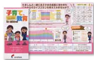
子育て・教育 ライフイベントリーフレット

また、子育て世代のお客さまへの情報提供として、今後のライフイベントが一目でわかる「子育て・教育 ライフイベントリーフレット」を作成し、住宅購入やお子さまの教育費など、今後のライフプランに関する相談を行っています。