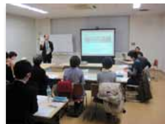
事業計画ブラッシュアップ ワークショップ