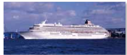
四国一周・瀬戸内海クルーズ