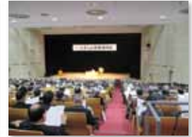
たましん RISURU ホール