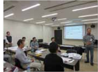
TAMA NEXT ファーマーズプログラム 講義風景