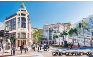
ビバリーヒルズ(イメージ)