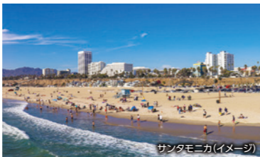
サンタモニカ(イメージ)

サンフランシスコ San Francisco ゴールデンゲートブリッジ、フィッシャーマンズワーフ等に加え、世界的なワイン生産地の『ナパバレーのワイン列車』にご乗車頂きます。