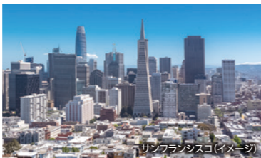
サンフランシスコ(イメージ)