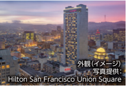
外観(イメージ)

サンフランシスコダウンタウンに位置する、サンフランシスコ最大規模のホテルです。ショッピング、エンターテイメント地区の近くにありま。