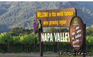
ナパバレー(イメージ)