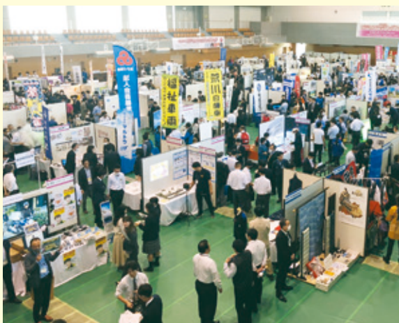
ビジネスマッチングフェア