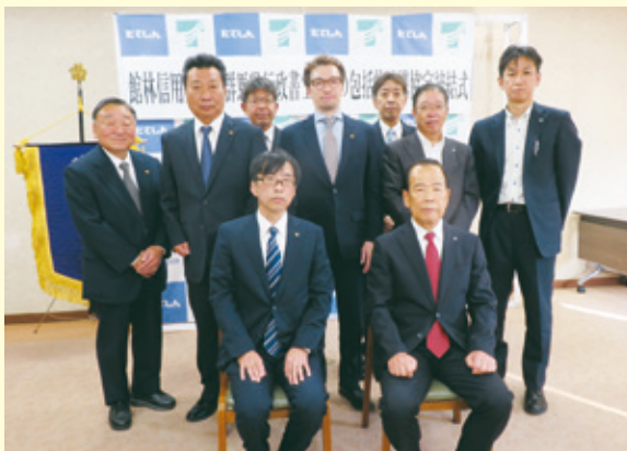
群馬県行政書士会との包括連携契約締結