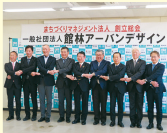
一般社団法人アーバンデザイン設立総会