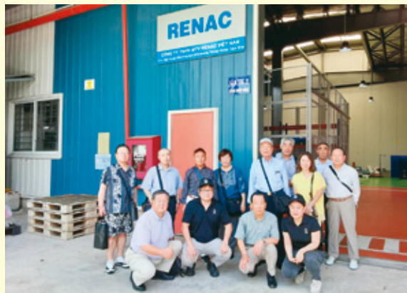
ビジネスクラブベトナム海外研修視察旅行