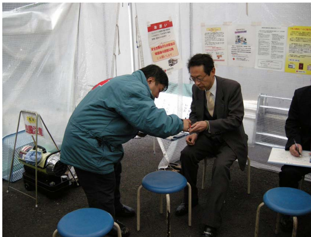
(問診票に答える。問診通過は思いの外狭き門です。)

59名の一次問診通過者を得、その中から献血適格者45名の方の採血を行うことができました。ほぼ、採血車の一日の採血能力いっぱいの量となりました。