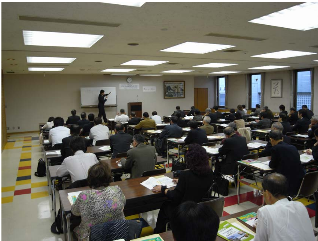
(会場は熱気にあふれていました)