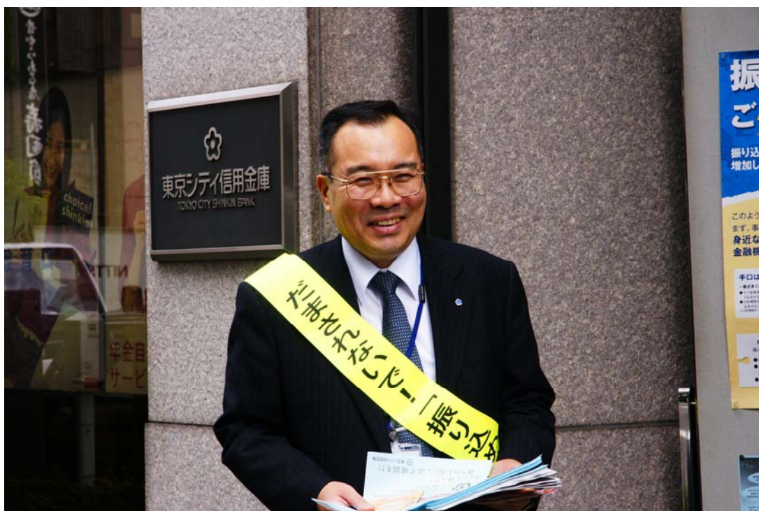
(お客様に振り込め詐欺の注意喚起チラシを配布する得意先係担当者)