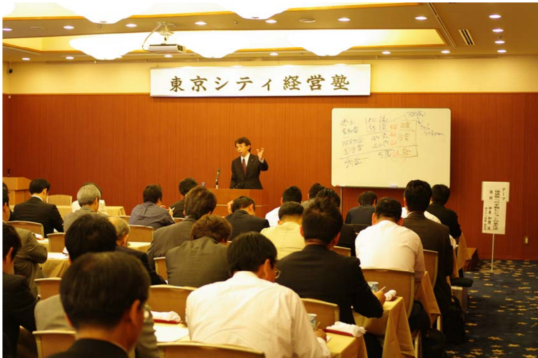
(真剣な講義が行われています)

これからの経営を担う次世代の経営者となる方を中心とした勉強会です。20年度は第1期(2年)の後半に当たり、より、具体的な計数把握の方法や、企業改善策等の講演を行いました。年間6回の講演、参加者は96名でした。