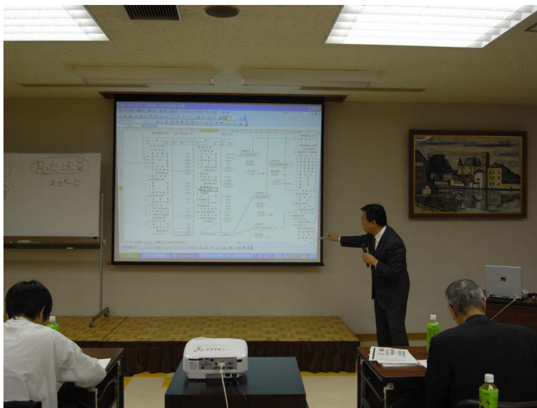
(決算書の構造の説明)