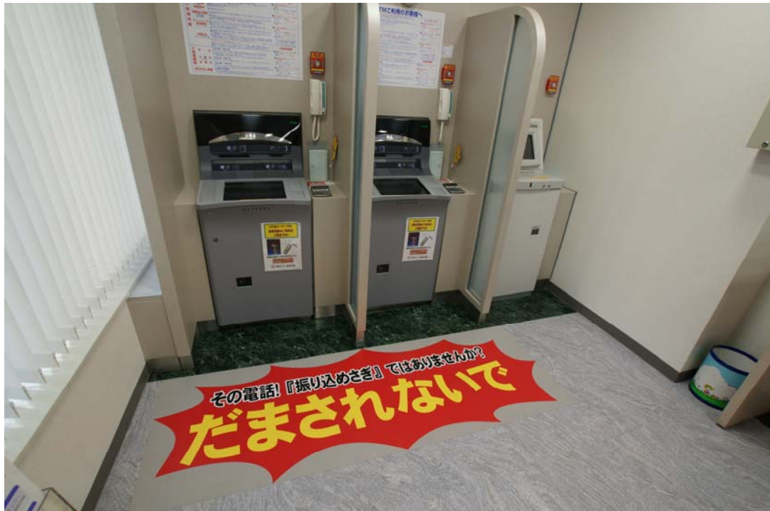
(日本橋支店設置の振り込め詐欺注意喚起マット)