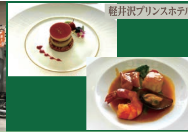
軽井沢プリンスホテル

1泊2日 予定コース → バス移動 ※添乗員1名が同行いたします 食事(1日目/昼食・夕食 2日目/朝食・昼食)