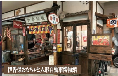
伊香保おもちゃと人形自動車博物館