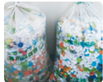
エコキャップ回収運動