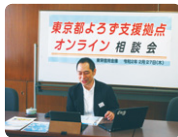
東京都よろず支援拠点 オンライン相談会