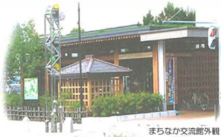
まちなか交流館外観

まちなか交流館は「気軽」に「ぶらっと」立ち寄れる場所づくりを目的として、地域住民の交流拠点とするとともに、地域の観光や地場商品のPR拠点として、多くの人が集い、触れ合う「コミュニティステーション」を目指すものです。