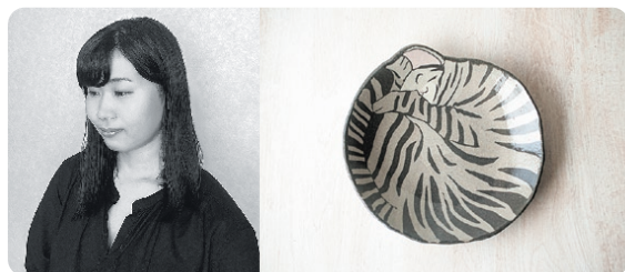
「練り込み まるくなるキジトラ猫」

1991 大阪府生まれ 2010 大阪市立工芸高等学校卒業 2014 武蔵野美術大学工芸工業デザイン科卒業 2016 多治見市陶磁器意匠研究所卒業 現在 多治見市にて制作