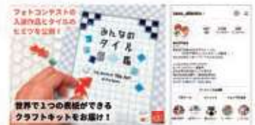
現在、実施期間は終了しております。

中小企業診断士やFP1級技能士などの専門知識を持った職員が所属する「とうしん地域活力研究所」が地域のシンクタンクとして活躍しています。信用金庫の本業である金融業務に留まらず、お客さまの本業支援、地域の街づくり支援、NPO法人支援、地域経済分析、SNSを活用した地域情報の発信、クラウドファンディングまで幅広く取り組んでいます。