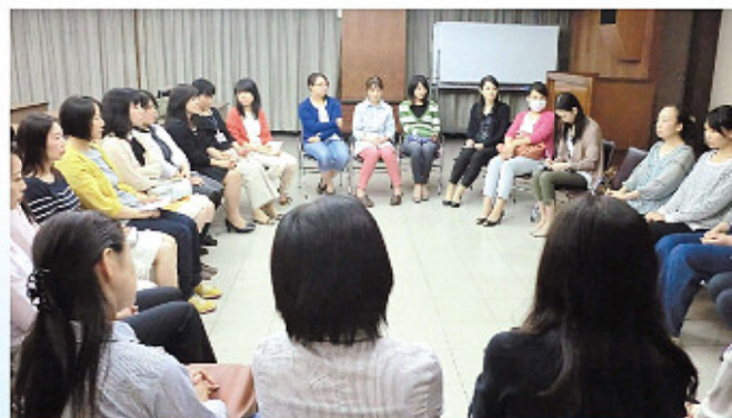
「チームなでしこ」が女性社員を対象に座談会を企画。交流を囲み女性の活躍を支援する。

2014年には女性社員による「チームなでしこ」を公募し、現在13人が活動中。2015年には地域イベントへの出展を企画し、アンケートや個別相談を行って成約に結び付けた。同社では女性職員を対象に座談会なども実施しており、コミュニケーションの活性化と、女性のさらなる活躍をバックアップする。