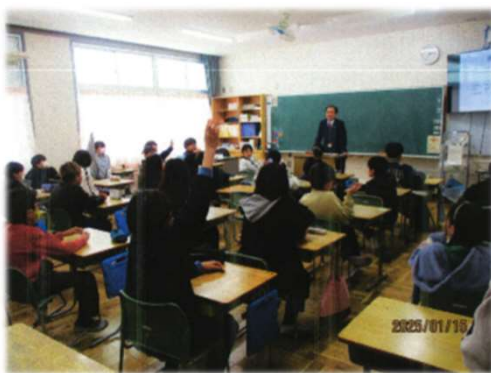
2025年1月15日 東郷町立諸輪小学校にて出前授業を実施しました。