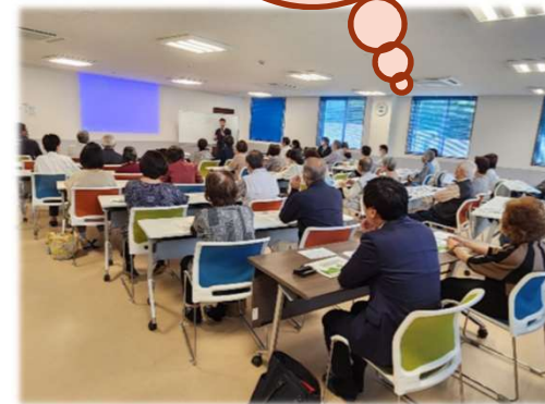
2024年4月30日 益富地域包括支援センター「益富の楽園」にて