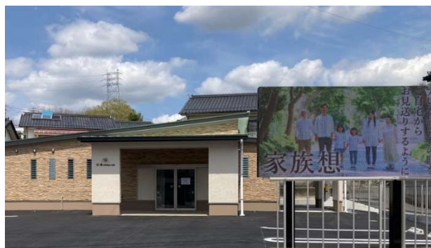
津山メモリアルハウス外観