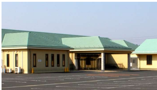
メモリアルハウス寶珠殿外観

これからも、大切な人との最後の別れや供養を手伝うことで、人々の心に寄り添っていく。