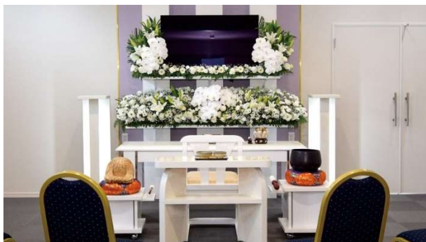
津山メモリアルハウス内観