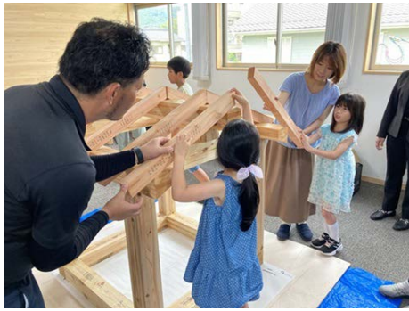
▲施工体験の様子。実際に木材に触れ、親子で一緒に小さな木の家を組み立てました。

7月24日(水)に、当金庫二宮支店にて、「木育」イベントが開催されました。本イベントは、持続可能な地域環境をつくる一助とするために、木の役割と大切さを子供たちに伝える「木育事業」の一環として院庄林業株式会社様が各地で開催しているものです。 イベントは岡山県の森についての木育授業から始まり、施工体験や二宮支店新店舗内の見学を行った後、木工教室では親子で木の椅子作りを楽しみました。 参加した子ども達からは「ひのきの匂いが良かった」「楽しかった」などの声があがっていました。