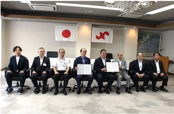
▲締結式にご参加いただいた方々