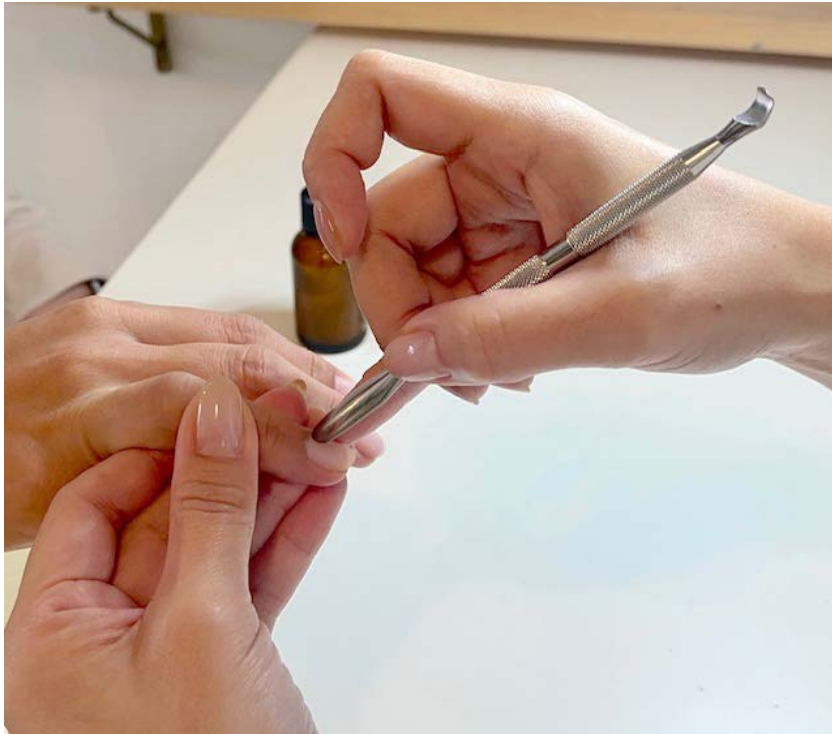
▲ATELIER NULLではマシンは使わず、一本一本丁寧に手作業で施術を行う。「爪を育てる」ネイルケアを通じてコンプレックスを自信に変え、指先から日々の生活を明るくしてくれる。