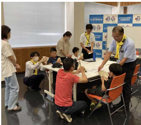
▲親子で札勘体験をしていただきました。

当金庫では小学生を対象に「つしんマネースクール」を行い、お金の大切さを学んでいただきました。また、金庫内の見学や、親子で一緒に札勘(お札を数える)体験を楽しんでもらいました。