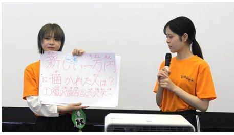
▲美作大学の学生さんによるクイズ