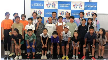
▲参加した子どもたち

庫との「産学連携の推進に係る協定」に基づくコラボ事業として、美作大学児童文化研究部の学生さんに、クイズ(500円玉を1枚作るのにかかるお金はどのくらい? 新一万円札の顔は? 等)やお財布作りなどの楽しい授業を行っていただき、大変盛り上がりしました。 参加した子どもたちからは「2億円の重さにびっくりした」「お金の役割がよくわかった。貯金も頑張りたい」などの元気な声がかれました。