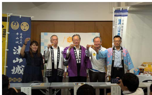
▲津山生姜エール完成披露式の様子