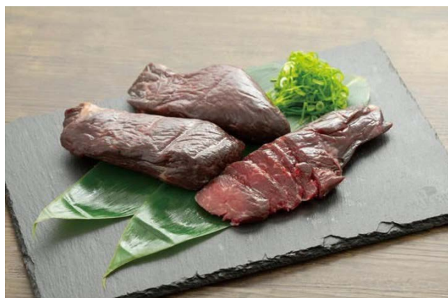
▲人気商品の「干し肉」。柔らかいモモ肉を使用しており、絶妙な塩加減が肉の旨みを引き出している。おつまみにもピッタリの一品。