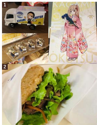
1.「奥津かがみ」コラボグッズ 鏡野町内でのみ販売している限定グッズ。ここでしか買えないグッズを求め、遠方からも多くのファンが訪れている。 2.発芽玄米ライスバーガー 移動販売商品の中で一番人気のメニュー。もちもちとした玄米のパンズで甘辛い具を挟み、香ばしく焼き上げた和風バーガー。