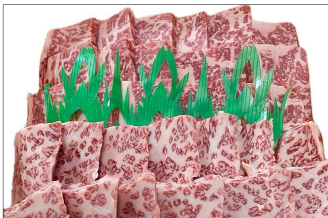
▲赤身と脂肪のバランスが良く、柔らかい肉質が特長の「町川牧場」の牛肉。甘味、旨味がたっぷりで美味しいと評判。