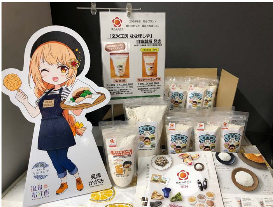
▲玄米粉 栽培期間中農薬・化学肥料不使用の安心・安全な玄米を、栄養を残したまま自家製粉した玄米粉。グルテンフリーのため身体に優しく、小麦アレルギーのある方でも安心して食べられる。