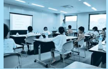
金融教育プログラム