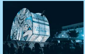
真田幸村公出陣ねぶた

住宅ローンの他にもしんきんには マイカー、教育、リフォーム等 お得なローン がいっぱい!! 各種お問い合わせ等は ローンセンター専用フリーダイヤルまで