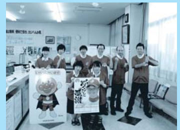
信濃グランセローズ応援