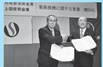
利根郡信金と業務提携