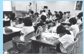
金融教育プログラム