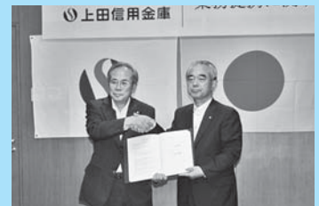
上越信金と業務提携