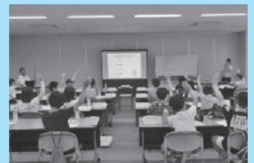
金融教育プログラム