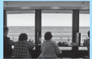
上田市内店舗合同年金信和会旅行