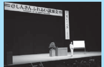
しんきんふれあい講演会