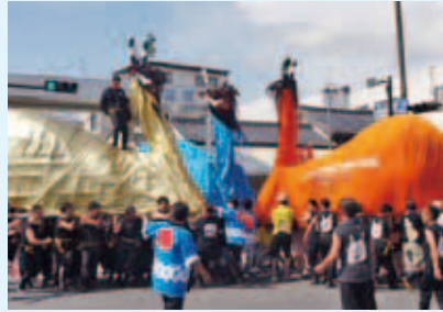
うわじま牛鬼祭り 2012