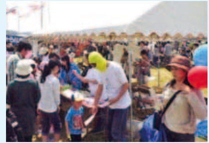
宇和れんげまつり