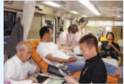
献血ボランティア