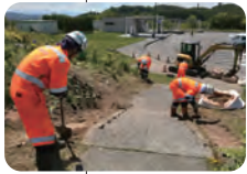
土木や電気、危険物、衛生、保全に関する資格も必要とされる。

冬期のNEXCO東日本さんのCMをご覧になられた方ならご存知かも知れませんが、通常除雪車(貸与車)は4台編成で行います。上り下り両線を周りますが、その編成を一梯団といい、私どもでは当社の目の前にある旭川北IC基地に一梯団、和寒IC基地に二梯団を