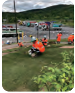
植栽や樹木の手入れも高速道路は重要な仕事。

今後現状に甘んじることなく、社員の資格取得のための各種サポート制度、教育、研修、講習会、安全大会、勤続表彰、健康管理を充実させ、個人の能力をいかに