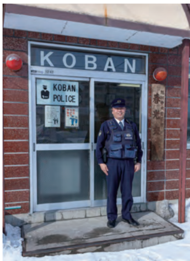
●旭川中央警察署 春光交番 旭川市春光1条8丁目12番47号 ☎0166-51-6456

警察官を騙る振り込め詐欺の手口 振り込め詐欺では、警察官を騙り「あなたのクレジットカードが不正使用されています」「これから○○警察署の○○刑事事ご自宅にカードの確認のため伺います」などと電話をしてきて、被害者に考える時間や余裕を与えることなく、ただちに受け子と呼ばれる犯人がやって来て、カードをだましとられる特殊詐欺が横行していますので、気をつけてほしいと思います。 予防策としては、家にいる時でもいつでも留守番電話にしておくことをおススメします。すぐに折り返し相手を確認できずし、詐欺グループは声を録音されることを嫌います。また、もし警察官を騙ってきた場合は、迷わず110番し「○○警察署に○○さんという刑事さんはいますか？」とお尋ねください。真贋はすぐに分かりますので。