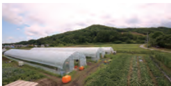
現在、登録者数は22名 ここで働きたいという希望者は多い

土地を耕す、種を蒔く、苗を植える、水を撒く、除草する、その手入れなどを繰り返し、時には非常に厳しい自然環境の中でも身体を動かし、汗を流し、日々成長していく植物の命と向き合いながら一喜一憂し、それでも最後に収穫の喜びの時を迎え