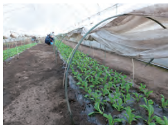
将来的には独自の加工・販売会社を設立し、 一般就労の場として正規に働いてもらうのが夢とか