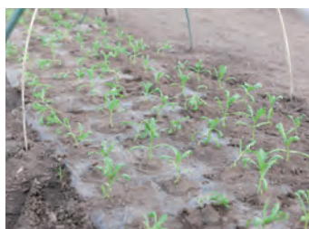
冬は葉物野菜が中心 種まきから収穫まではおよそ2ヵ月とのこと