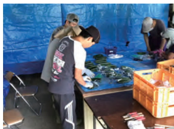
10代～50代までが一緒に作業をしている 利用者の方の住まいも札幌市南区が中心