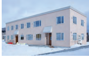
ファミリーホーム スミールヒュース(南区藤野)