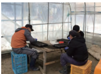
種を一つずつポットに植えていく利用者のみなさん もちろん袋詰め、梱包も自分たちの仕事