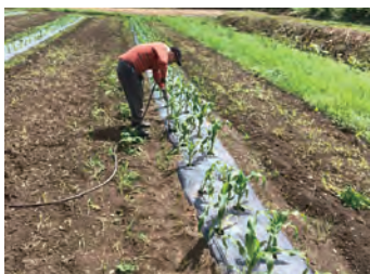
基本的に無農薬・減農薬栽培 地域の農家の方も良きアドバイザー