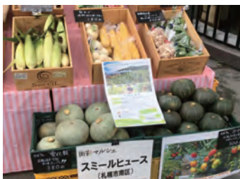
直売所のほかコープさっぽろのご近所野菜(南区3 店舗)、ジャスマッププラザホテルの青空市でも販売