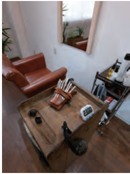
広くゆったりとしたスペースが特徴 ▲スタイリングチェアとドレッサー×2 ▼シャンプーユニット×2

①受付カウンター近くに貼られている北海道地図。これを見ながら各地の位置を覚えているとか。 ②木藤さんの出身地の瀬戸焼きも紹介しています。