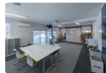
スタッフルームは2カ所。とても整理整頓され、ローテーションなどもホワイトボードにまとめられている。新型コロナウイルス感染症対策も施されている。

路の安全と安心を守るプロフェッショナル集団として、この社会的意義が大きい交通インフラの仕事に邁進していきます。