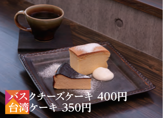
バスクチーズケーキ 400円 台湾ケーキ 350円

旨さを引き出す絶妙な揚げ加減。野菜はその時々で変わります。焼きカレーとともに、女性に人気のあるカレーです。