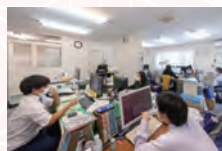
事務所内部と建物の外観