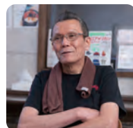
株式会社 楔(くさび) 代表取締役

ラーメン店を創業しました。なるほど、店名の「くさび」には、建築業界のなごりが刻まれているのでしょうか。繋目や隙間に打ち込む楔は、見えてしまうと用を成さない面があります。人と人との繋がりにおいても大事な心遣いは、人知れずに行つてこそ意味があるのだと語っているかのようです。見えないところも手を抜かない、それがくさびのやり方です。