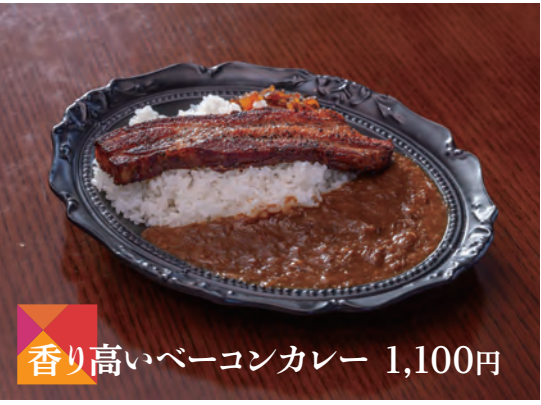
香り高いベーコンカレー 1,100円

「デザートもすべて私の手づくりで、ショーケースも用意してあります。土日だけの限定デザートもおすすめですので、気軽にスタッフまでお声かけください。セット注文の場合は、お飲みものの割引もあります。」