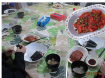
作業後は収穫した野菜をみんなでいただきます！ 嗜好や栄養価を考慮し楽しく食事を摂れるよう配慮

ることができ、言うならばモノづくりの全工程を体験できる、まさに「働く喜びを感じる」生産活動だということだが、この事業に携わったばかりの自分でも実感することができました。人には向き不向きがあるものですが、例えどのような障がいをお持ちの方でも必ず担っていただけ作業工程と役割があります。」