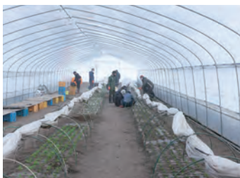
ビニールハウスは3棟設置し、通年栽培 冬でも日が射していれば暖房なしでも24℃ほどに