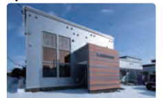
2019年8月に新築落成。道央自動車道、旭川北ICから500mの位置に立地。