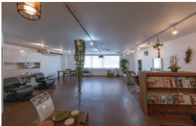
美容室 SUKIMA 札幌市清田区真栄1条2丁目1-28真栄ビル1階G号 TEL/FAX 011-375-7200 営業(活動)時間/10:00~18:00 定休日/第2第4日・月