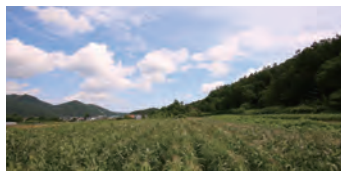
見渡す限りのとうもろこし畑 事務所・農場まで利用者専用の無料送迎バスも完備