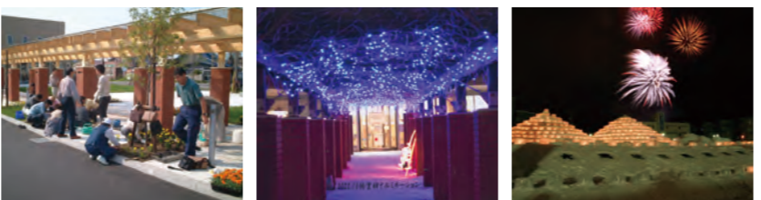
図書館友の会/花いっぱい運動 図書館友の会/イルミネーション 大発協/アイスクャンドル事業