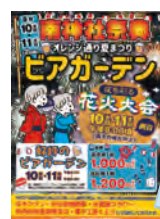
◀南神社祭の昨年のポスターとピアガーデンチケット

2020・2021年はコロナのため中止。昨年は感染拡大を防ぐためテイクアウトにて開催。