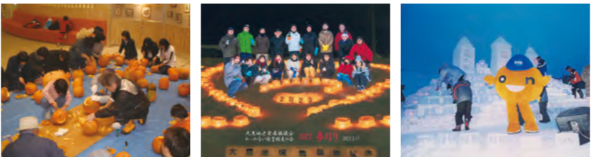
図書館友の会/ハロウィン事業 大発協/図書館友の会/夢灯り 大発協/新聞やテレビでも報道