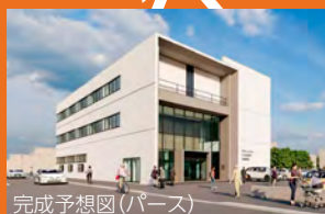
完成予想図(パース)