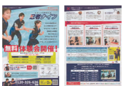
ゴールデンエイジ世代向け忍者ナインのチラシ