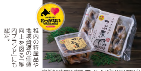
自然解凍で2時間、電子レンジ500Wで2分。

解凍後は殻から出して、そのままどうぞ。 殻ごと突ったり、少し蒸すと、より美味しさが引き立ちます。