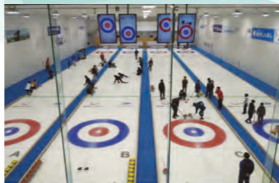
未経験者からアスリートまで対応するカーリング

アメリカの医学者であるスキヤモン博士が1928年に発表したとされる『スキヤモンの発育曲線・成長曲線』は、今や全世界のスポーツ科学のバイブルとも呼ばれ、要約するとヒトの神経機能は5歳頃までに約80%、12歳頃にはほぼ100%形成されると提唱しています。すなわち●プレゴールデンエイジ5〜8歳頃 ●ゴールデンエイジ9〜12歳頃 とされ、その時期をどう過ごすかによって、以後の運動能力が決まってしまうとのこと。