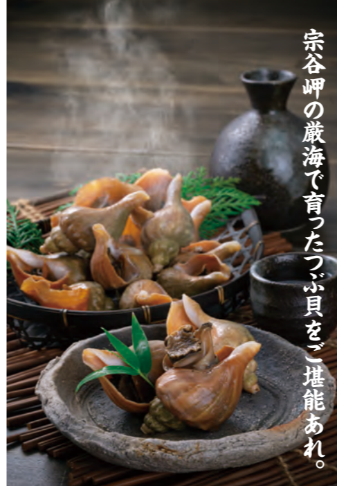
宗谷岬の厳海で育つたつづ貝を、堪能あれ。

解凍後は殻から出して、そのままどうぞ。 殻ごと突ったり、少し蒸すと、より美味しさが引き立ちます。