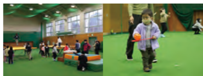
多くの親子連れの市民で賑わうスポーツフェスタ