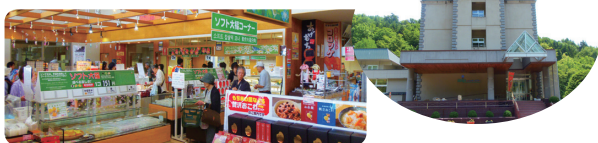
稚内支部会員の皆さま「なよろ温泉サンピラーと道の駅もち米の里☆なよろ日帰りの旅」