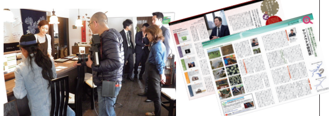
○2017年6月 第20回信用金庫社会貢献賞「Face to Face賞」受賞

宗谷をはじめとする地元を再発見する企画や中小企業をフォーカスするコーナー、地域住民の趣味や特技にスポットを当てるコーナー、管内の交番勤務のおまわりさんを紹介するなど、地域の情報が盛りだくさんです。