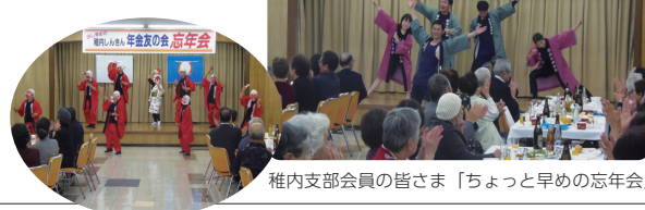
稚内支部会員の皆さま「ちょっと早めの忘年会」