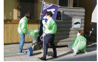
南支店周辺清掃活動(2022年6月15日)