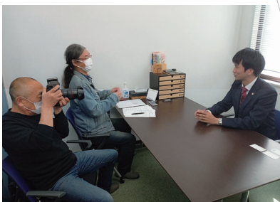
○2017年6月 第20回信用金庫社会貢献賞「Face to Face賞」受賞