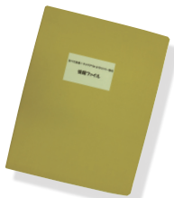
食べて応援! テイクアウト&デリバリー 情報ファイルを全店に配付。