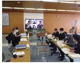
環境に関する会議等への積極的参加