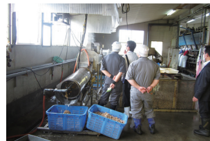
○HACCP認証のための 視察の様子