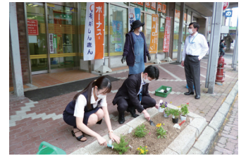
花いっぱい運動(2021年6月30日)