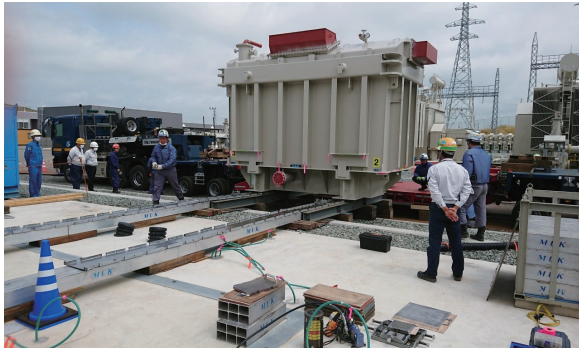
大型変圧器の据付作業