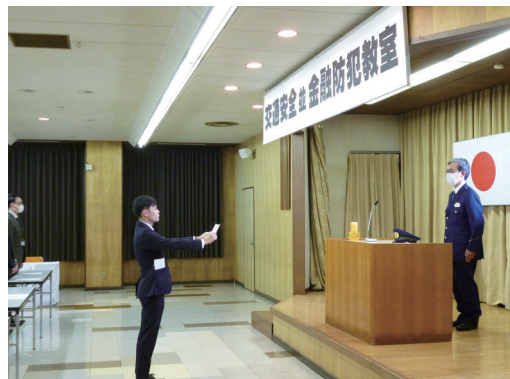
交通安全宣言 宣言する稚内信用金庫職員