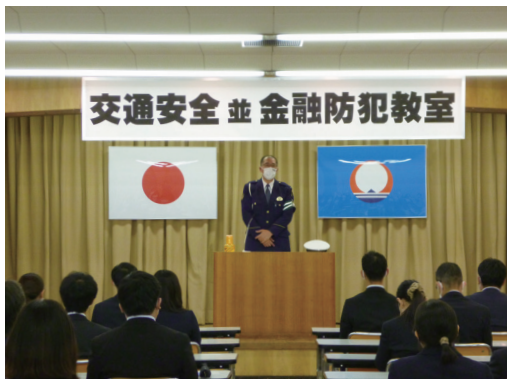
交通安全並びに金融防犯教室（2021年11月15日） （稚内警察署の協力により1976年より実施）

また、毎年度コンプライアンスを実現するためのコンプライアンス・プログラムを策定し、「コンプライアンス教育研修」等を実施しています。