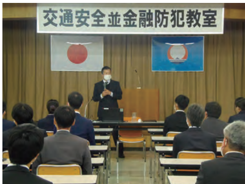
交通安全並びに金融防犯教室（2022年11月4日） （稚内警察署の協力により1976年より実施）

また、毎年度コンプライアンスを実現するためのコンプライアンス・プログラムを策定し、「コンプライアンス教育研修」等を実施しています。