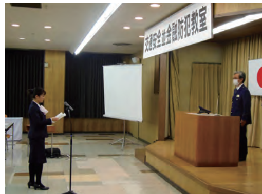
交通安全宣言 宣言する稚内信用金庫職員