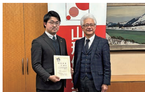
産学連携コーディネーター認定授賞式