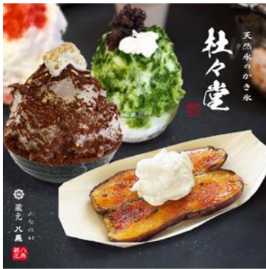
天然かき氷専門店「杜々堂」