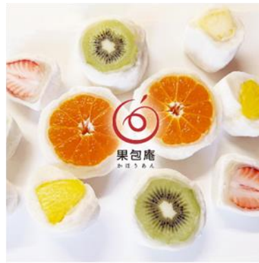
フルーツ大福専門店「果包庵」