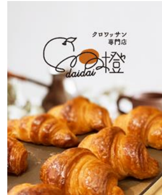
クロワッサン専門店「橙」

地元の方や旅行者の方に訴求できるような魅力的なスイーツ店を複数出店し、SNS等を通じた情報発信を強化することで、まちの賑わいを創出するとともに、皆生温泉エリア全体の周遊性を高め、観光振興にも貢献することが期待されます。