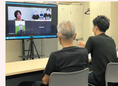
・オンライン商談会の様子