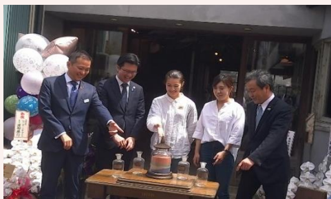
・第1号投資先の開業