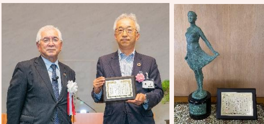
・Face to Face賞の受賞（令和4年6月）