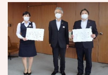
振り込め詐欺防止の表彰受領