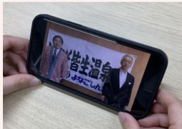
・観光PR動画の制作