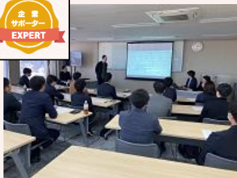
「企業サポーター」研修

➢ 「企業サポーター育成制度※」や「ライフプランサポーター育成制度※」、課題解決の好事例を共有する「ベストプラクティス会議」などを通じて、全職員が課題能力を有する信用金庫を目指しています。