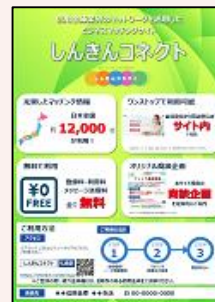
しんきんコネクト