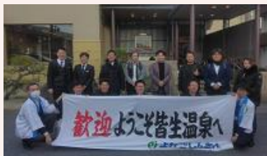
お客さまのお出迎え

➢ 全国の信用金庫ネットワークを活かし、平成13年（2001年）から20年以上に渡って、皆生温泉への観光誘致活動を実施しています。令和6年度は、関東方面の信用金庫を訪問し、観光誘致活動を行いました。