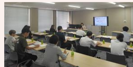
(上) フェア会場の様子 (下) セミナーの様子

➢ 人材不足や働き方改革が進む中、お客さまの競争力維持や優位性強化、業務効率化の支援に取り組みました。