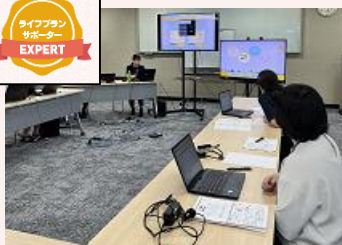
「ライフプランサポーター」研修

※ 企業サポーター育成制度…補助金支援や情報マッチング支援に加え、経営改善支援や事業承継・M&Aへの対応力を養成 ※ ライフプランサポーター育成制度…お客さま（個人）のライフステージに応じた最適なアドバイスやニーズに合わせた幅広い提案力を養成