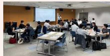
(上) 懇親会の様子 (下) セミナーの様子

➢ 経済産業省「地域の人事部」事業を活用し、地域の若手経営者や後継者が、経営に関する知識と実践的なスキルを学び、経営力を高める支援を行いました。