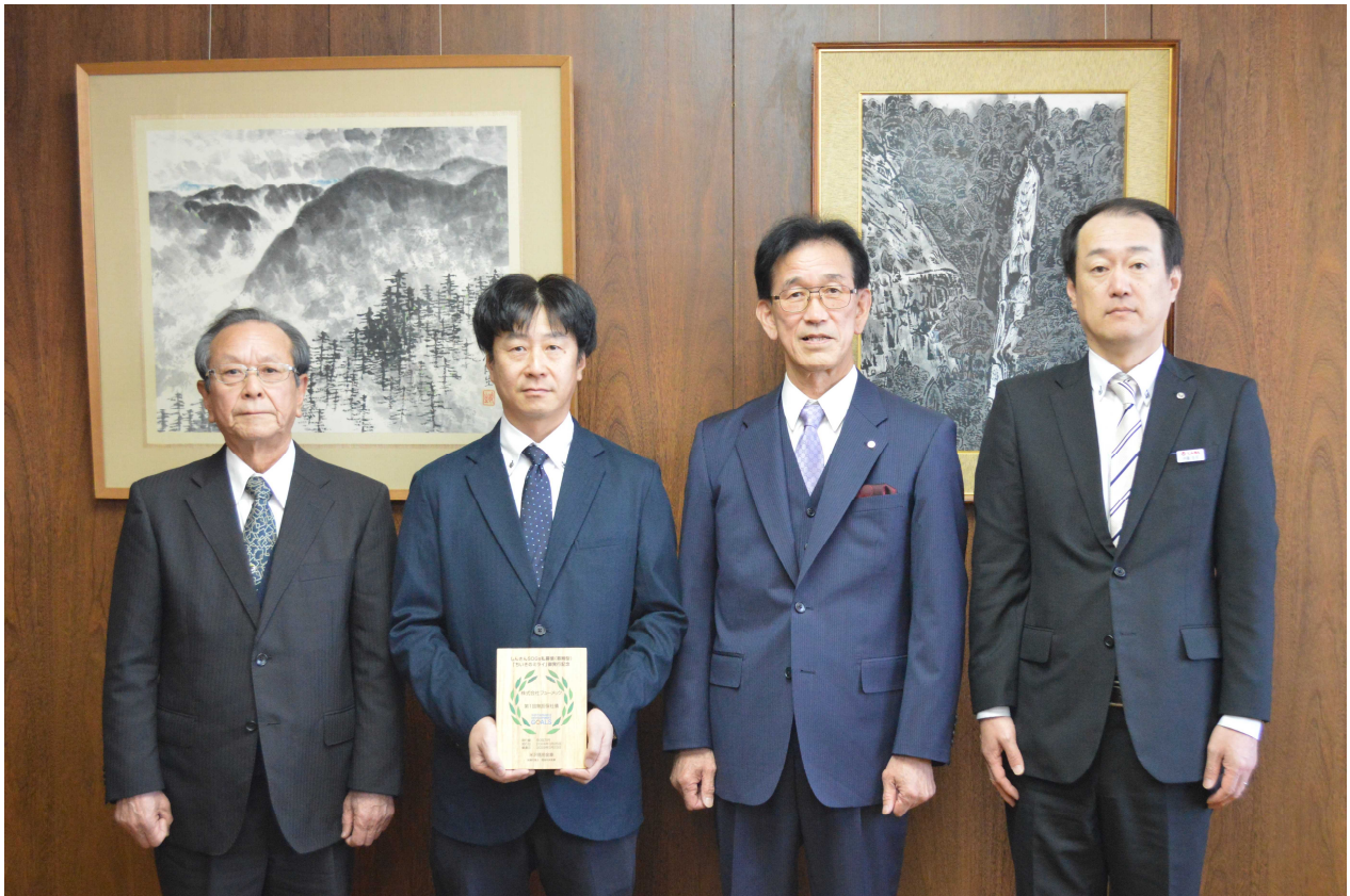
【私募債記念楯贈呈の様子】