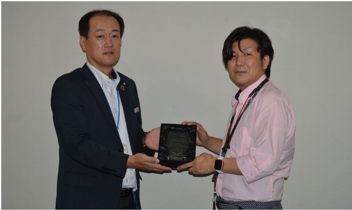
【私募債記念楯贈呈の様子】