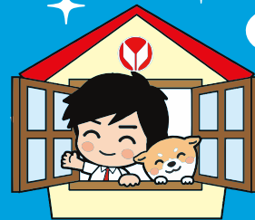
よねざわしんちゃん と よねしばくん