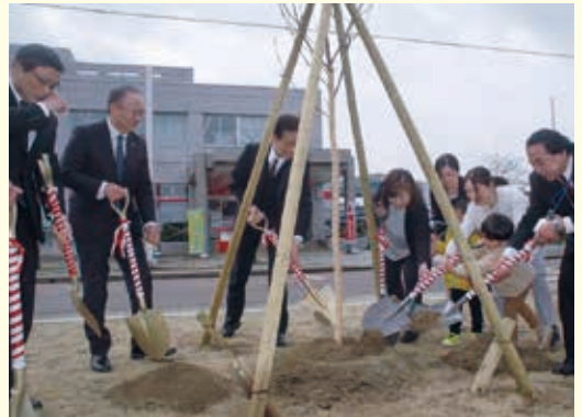
長井市へ桜の木寄贈