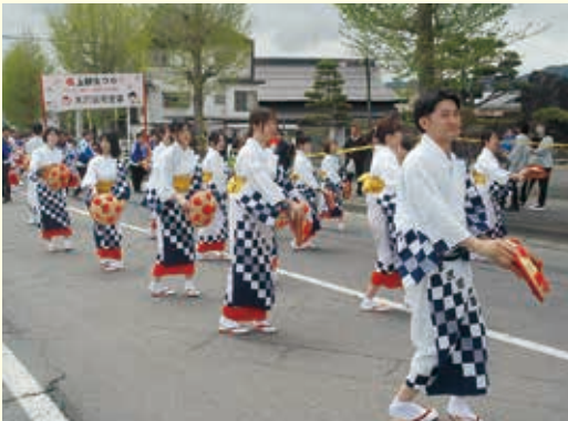
米沢上杉まつりへの参加