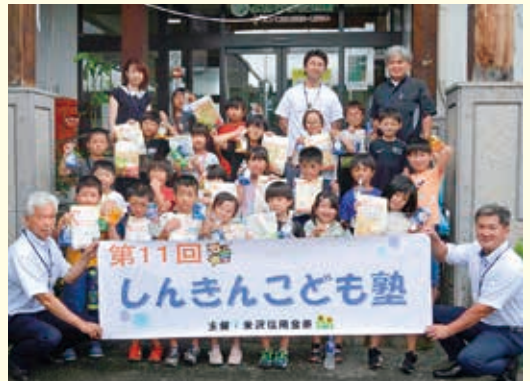
しんきんこども塾の開催