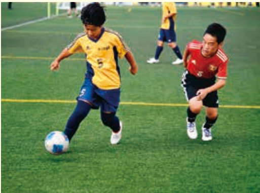
第17回米沢信用金庫杯 サッカー大会