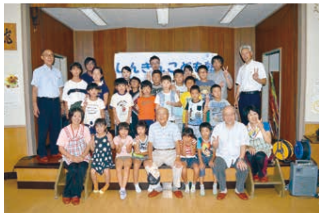
しんきんこども塾