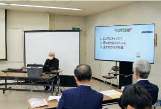
ビジネスクラブ～With～セミナー

地域を支える信用金庫とその事業基盤である中小企業の持続可能性を高めるとともに、地域活性化支援への取組を推進することで、地域社会の持続的な繁栄に貢献します。