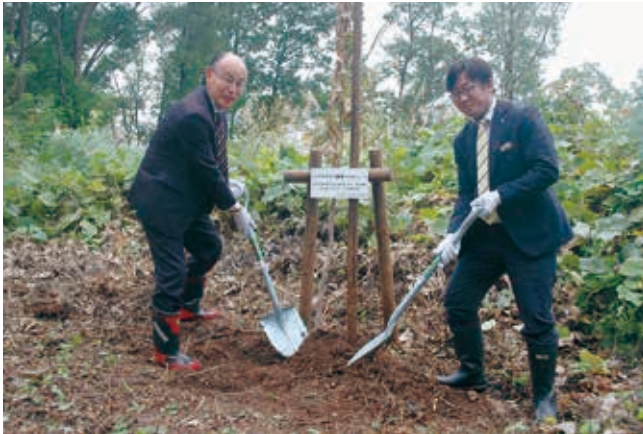
植樹や下刈りなどの森作り活動

事業活動における環境への負荷を低減することにつとめ、また地域の環境整備活動などに取り組み、地球環境保全に貢献します。