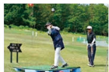
パークゴルフ大会