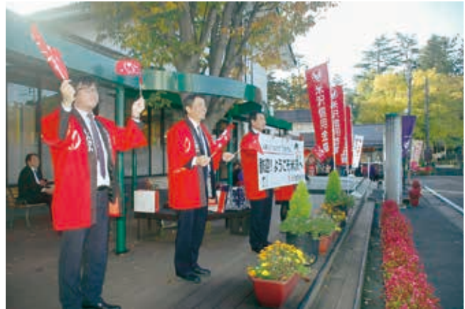
全国の信金ネットワークを利用した観光客誘致活動