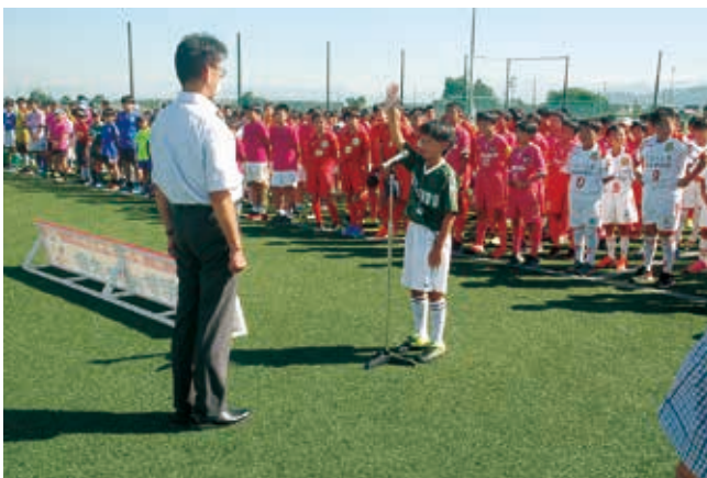
米沢信用金庫杯少年サッカー大会

地域の子ども達にスポーツや音楽を通して、質の高い教育を提供できるよう各イベントを開催しております。