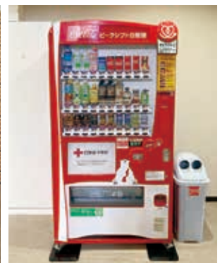
赤十字寄付金付自動販売機

※ユニセフ……最も支援の届きにくい子どもたちを最優先に、さまざまな活動を行っています。世界のすべての子どもの命を守り、健やかな成長を支え、明るい未来をつくるために、約190の国と地域で活動しています。