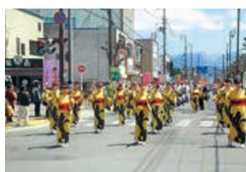
米沢上杉まつり参加