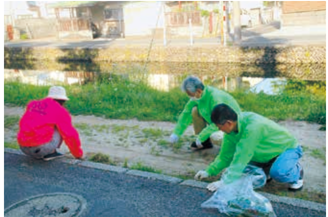
地域のボランティア清掃