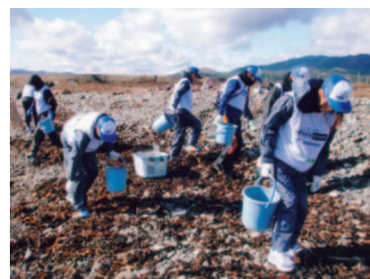
被災地へのボランティア活動