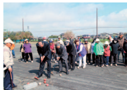
結城信用金庫杯県西地区ゲートボール大会

「ボランティア休暇」を設け、職員のボランティア活動への参加を推進しております。26年度は、16人の職員が東日本大震災被災地でのボランティア活動に参加しました。また、6月15日の信用金庫の日になんで、献血、清掃活動、募金活動などの地域貢献活動を実施しています。