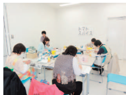
友部支店多目的ホール

また、友部支店には「多目的ホール」を設置し、地域の皆さまの交流の場として活用していただいています。