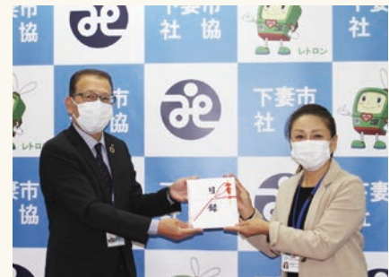
下妻市社会福祉協議会へ善意金を寄付