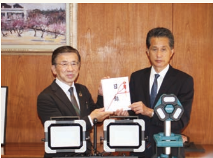
笠間市(10/20)、下妻市(10/27)に防災用投光器を寄贈