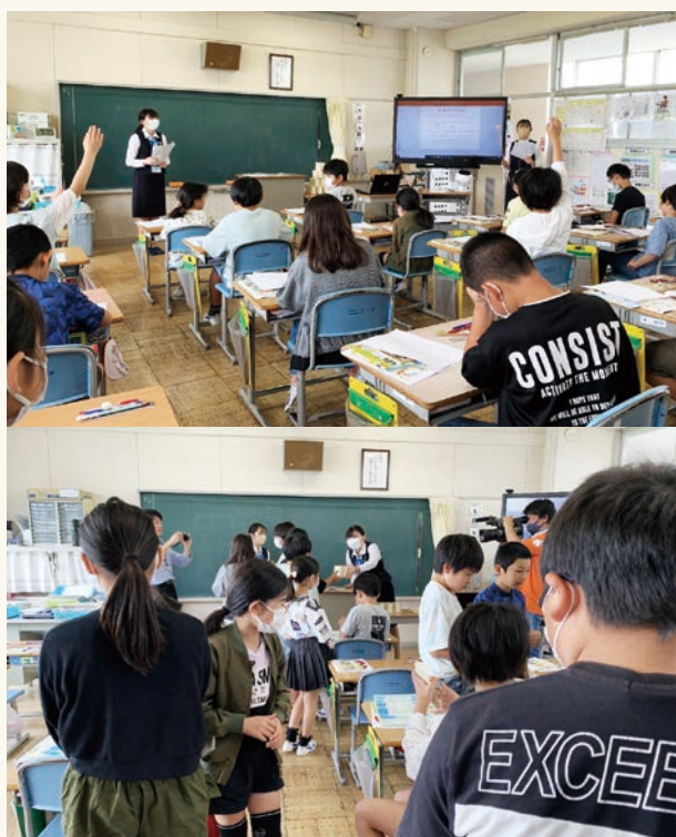
筑西市立上野小学校で金融教育（出前授業）を行いました。