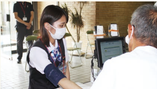
本店敷地内での献血の様子