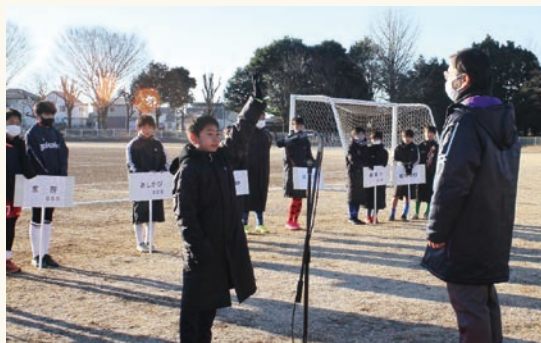
第9回結城信用金庫杯少年サッカー大会を開催