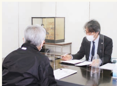
弁護士の個別相談方式による無料相談会