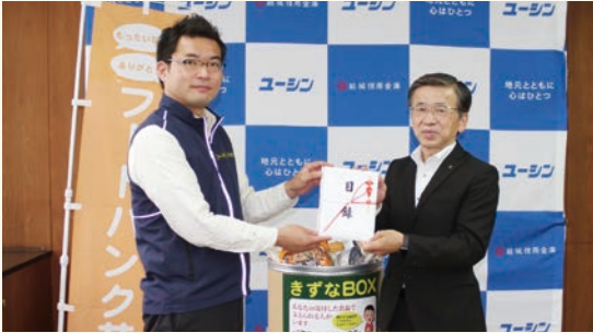
NPO法人フードバンク茨城へ食料品を寄贈