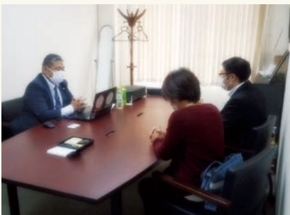
よろず支援拠点と連携した経営課題の個別相談会を実施