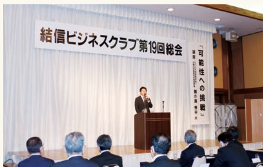
ダイヤモンドホール(筑西市玉戸)にて行いました。