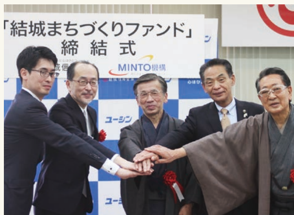
令和5年3月28日「結城まちづくりファンド」締結式を開催しました。