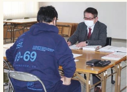
所得税還付申告相談会を実施