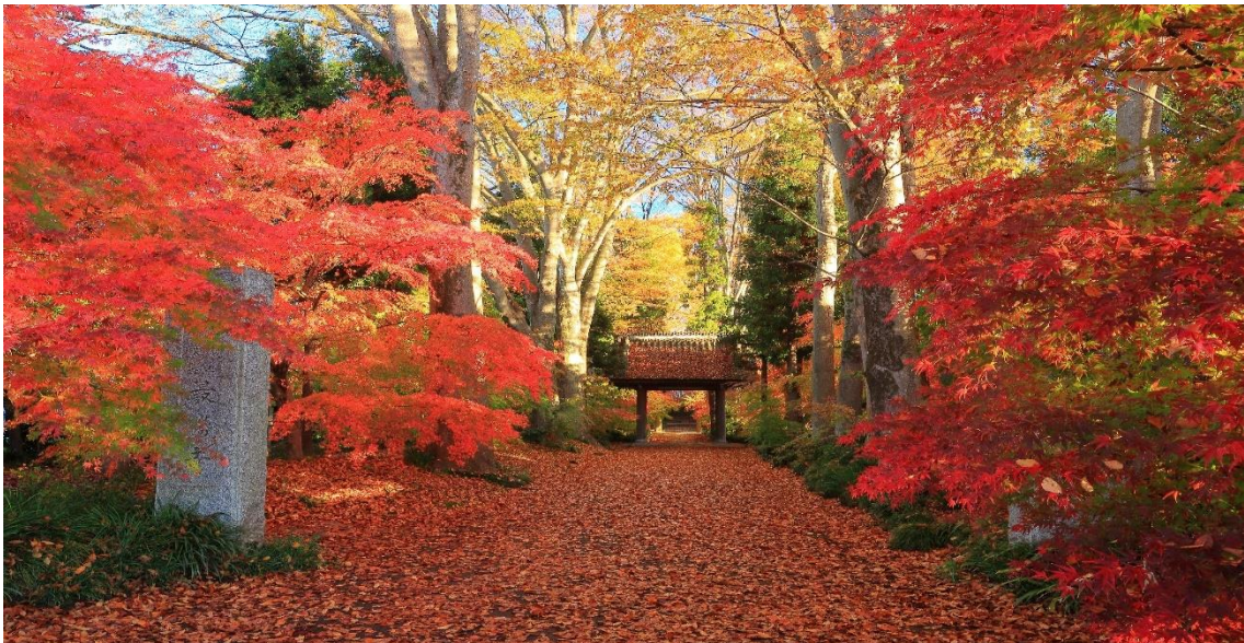
「燃える紅葉」【最勝寺（筑西市）】 稲葉 優 様