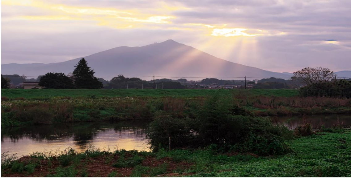
「光芒筑波山」【黒子橋付近から望む（筑西市西保末）】 阿路 靖彦 様